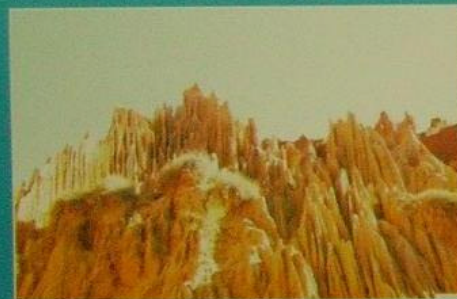
Erosão de Dunas/Marracuene